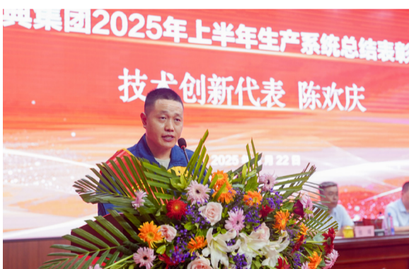
技术创新先进代表作了发言