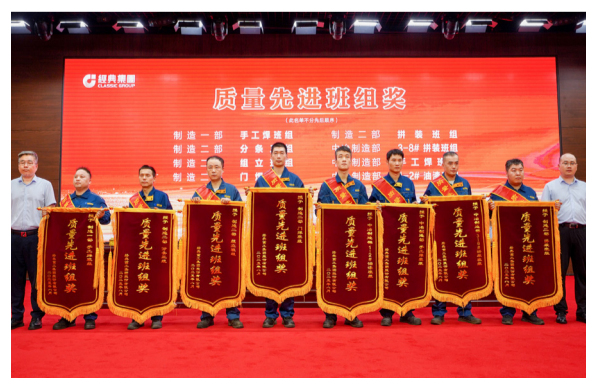
颁发质量先进班组奖